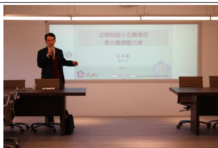
106. 12. 09 舉行法學院碩士在職專班學分費調整公聽會